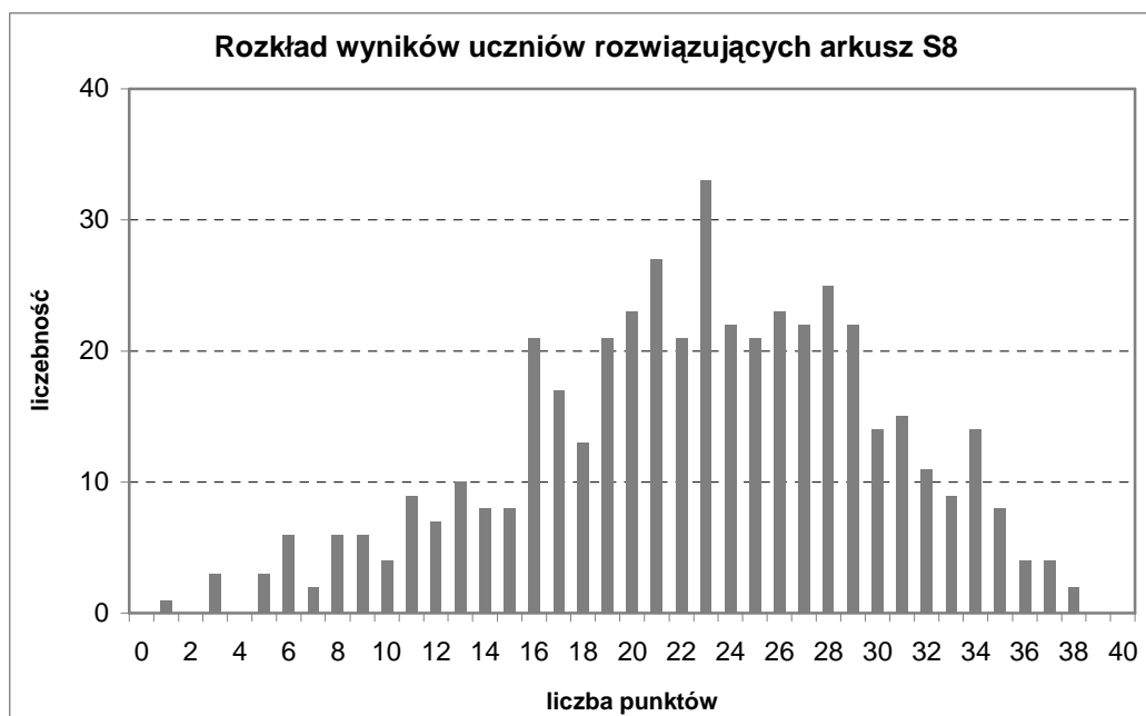
Rysunek 1. Rozkład wyników uczniów z trudnościami w uczeniu się (arkusz S8) – sprawdzian 2011.

Test dla uczniów rozwiązujących zadania z arkusza S8 był umiarkowanie trudny (0,57). Rozkład wyników uczniowskich jest zbliżony do rozkładu normalnego. Najczęściej występujący wynik to 23 punkty i jest on równy medianie.