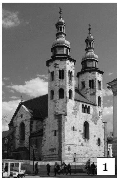
Kościół zbudowany w latach 1079–1098.

Na podstawie ilustracji wykonaj zadanie 5.