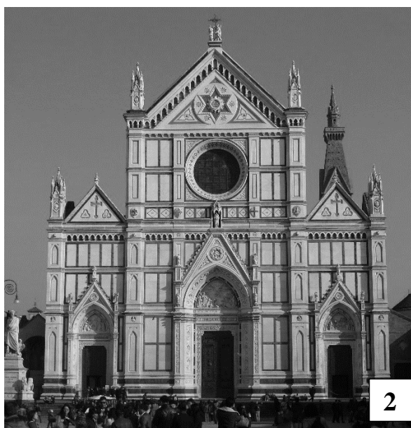
Kościół zbudowany w latach 1294–1442.